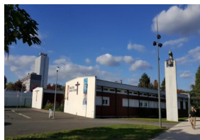
Église Saint Jean XXIII 9 rue Rabelais 94430 Chennevières