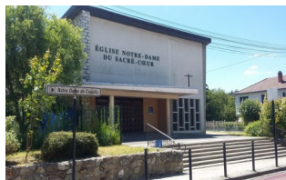
Notre Dame du Sacré-Cœur de Coeuilly 28 rue Colombe Hardelet 94500 Champigny