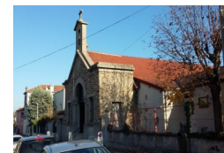
Église Saint Joseph du Tremblay 40 rue du Docteur Charcot 94500 Champigny