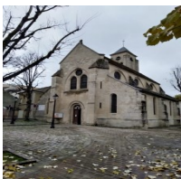
Église Saint Saturnin 11, Place de l'église 94500 Champigny