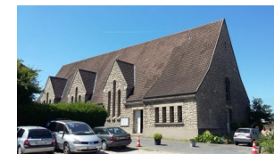
Église Sainte Bernadette 18-24 rue de la Côte d'Or 94500 Champigny