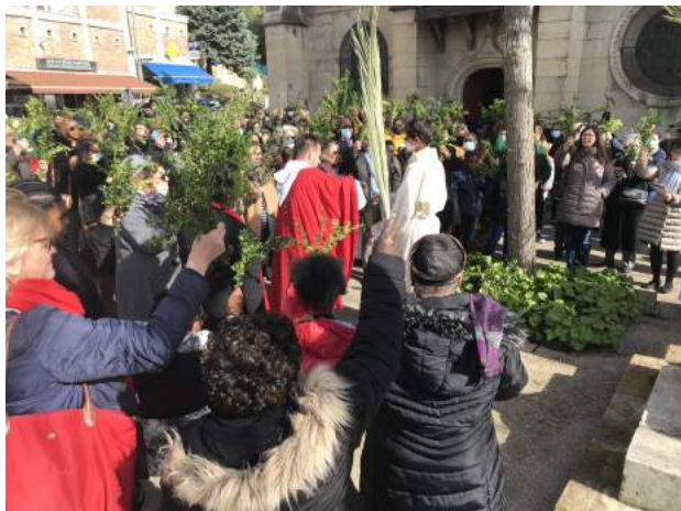
Dimanche des Rameaux