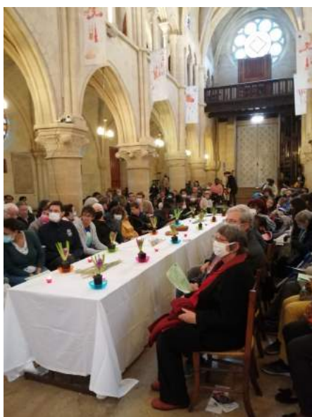
Jeu di Saint