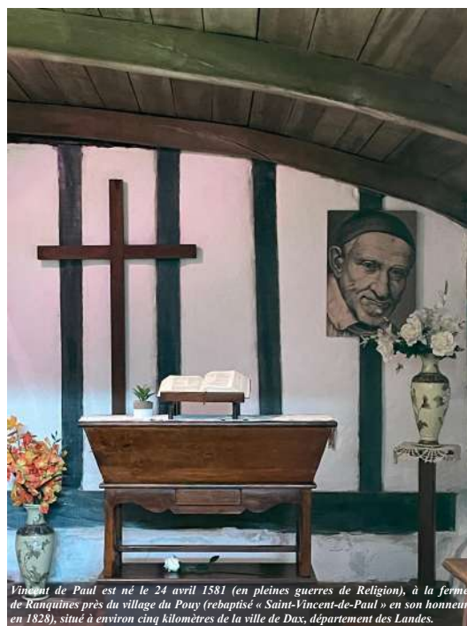
Vincent de Paul est né le 24 avril 1581 (en pleines guerres de Religion), à la ferme de Ranquines près du village du Pouy (rebaptisé « Saint-Vincent-de-Paul » en son honneur en 1828), situé à environ cinq kilomètres de la ville de Dax, département des Landes.

Du 17 avril au 19 avril 2026, les fraternités locales de différentes régions se sont réunies en pèlerinage au berceau de Saint Vincent de Paul (Landes) dans un climat détendu, un grand respect, une totale discrétion permettant à chacun de s'exprimer librement. Nous étions 47 participants.