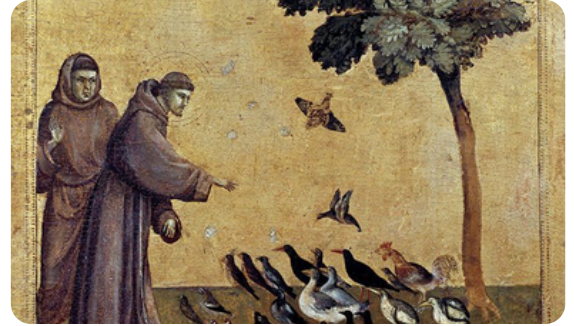
Giotto, Saint François prêchant aux oiseaux (1295-1299)

Louez et bénissez mon Seigneur, rendez-lui grâce et servez-le en toute humilité !