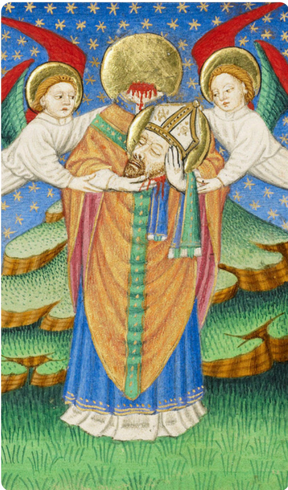
Saint Denis portant sa tête ; enluminure de sir John Fastoff, vers 1430-1440

Son histoire nous rejoint encore aujourd'hui. Elle nous rappelle que croire n'est pas toujours évident, que cela demande parfois du courage, de la persévérance, et des décisions profondes.