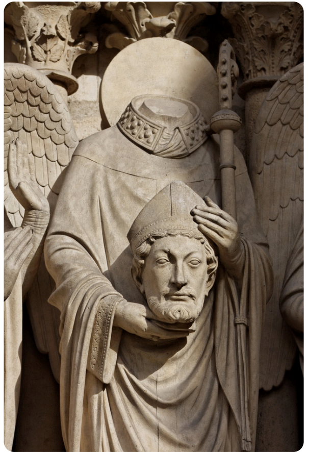
Saint Denis portant sa tête ; Notre-Dame de Paris (portail de la Vierge)

Mais cette liberté dérange. Il est arrêté puis condamné à mort. Selon la tradition, il est décapité sur la colline de Montmartre ( mons martyrium ) pour avoir refusé de renier sa foi. Il devient ainsi martyr: quelqu'un qui témoigne du Christ jusqu'au don total de sa vie.